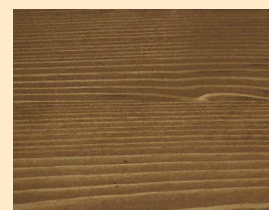
Bangkirai Nr. 110-85