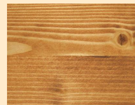
Teak Nr. 110-81