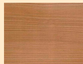
Lärche Nr. 110-89