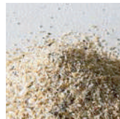
Perlmutter 1,2 - 1,8 mm