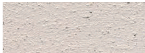
T-PAINT Dover Weiß mit Perlmutter, grob

Der reflektierende Effekt des Perlmutter kann auf dem Strukturmuster nicht dargestellt werden.