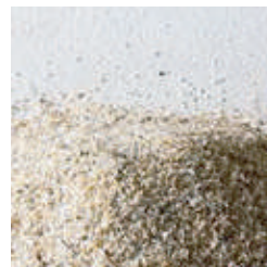
Perlmutter 0,8 – 1,2 mm