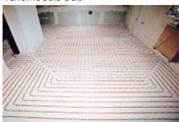
...nog gelijkmatiger kan niet...